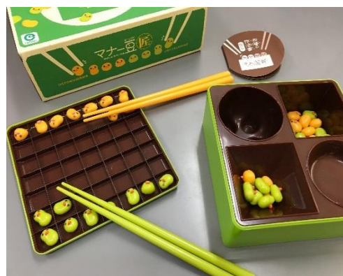
目と手の協応運動