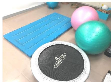
トランポリンなど