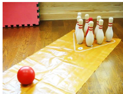
ボーリングゲーム