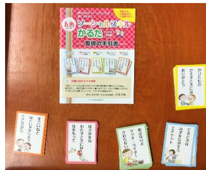
ソーシャルスキルかるた