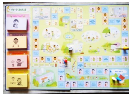
役割演技すごろくゲーム