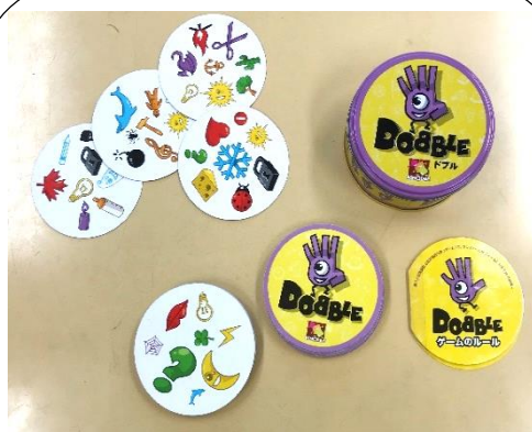
ビジョントレーニング